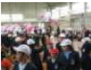
〔6年生に手を引かれて花道を入退場〕

児童会の役員は、計画や準備、会の運営等、1年生の立場に立って、細かい所まで気を配りながら一人一人が役割を果たしていました。これからも、中央小学校を引っ張っていくことを期待させてくれる素晴らしい集会となりました。