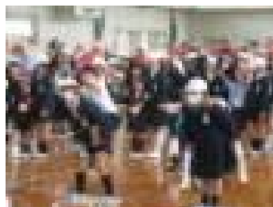
〔6年生と一緒にゲームを楽しむ1年生〕