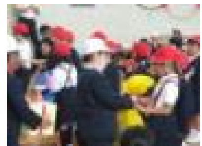
〔各学年からプレゼントを受け取る1年生〕