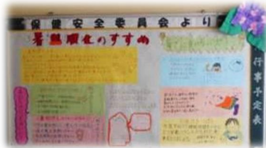
○ 暑熱順化について(保健委員会)