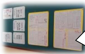
○ 上手なノートの 使い方(英語科)