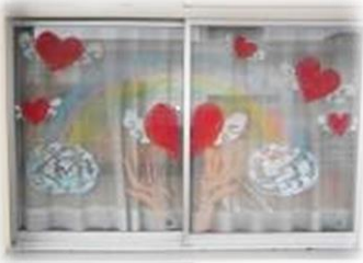
○ 本「虹色のチョーク」の チョークを使って(図書室)