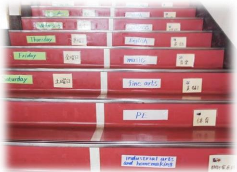
○ 階段を利用して (ほのぼの学級作)