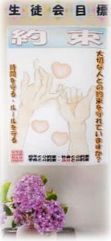
○ 月目標(7月) 生徒会総務